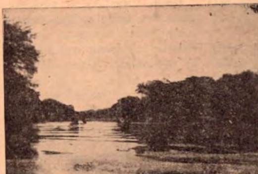
EL CAUDALOSO RIO TEMPISQUE A SU PASO POR FILADEL- FIA EN GUANA- CASTE.