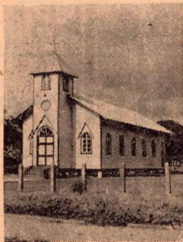
LA PEQUEÑA IGLESITA CATOLICA DE PUERTO CORTES

EMPRESA DE NAVEGACION DE RAFAEL BARRANTES