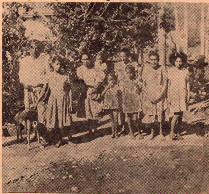
Una familia indígena en la zona aborígen de Palmar y Térraba por Puerto Cortés.