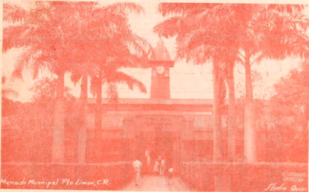
Mercado Municipal, Pto. Limón, C.R.